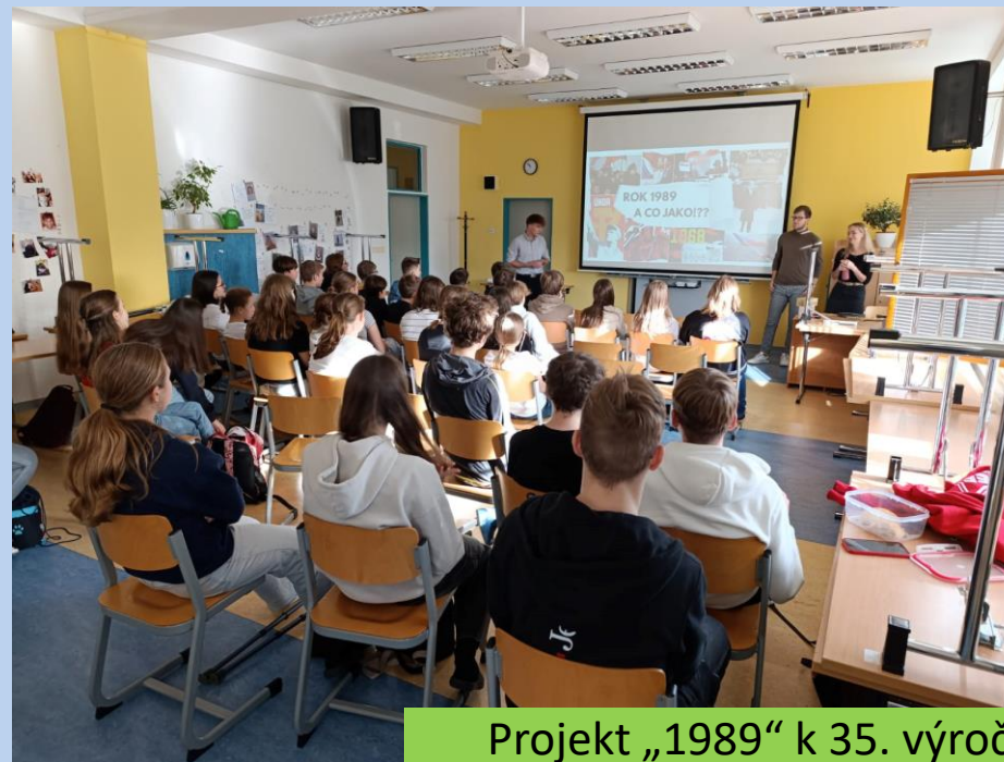
Projekt „1989“ k 35. výročí listopadové revoluce