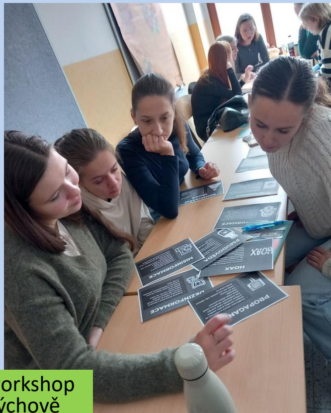
Fakescape workshop k mediální výchově