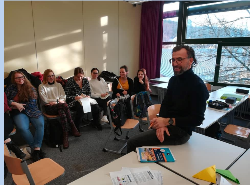
Didaktická exkurze Ingolstadt – Eichstätt, listopad 2022