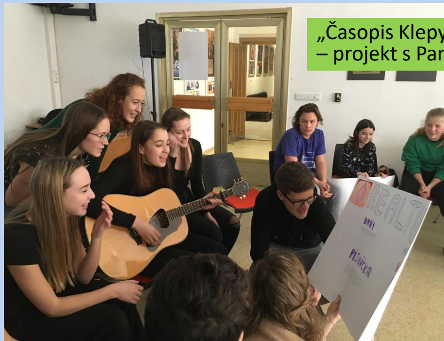
„Časopis Klepy a holocaust“ – projekt s Pamětí národa JČ