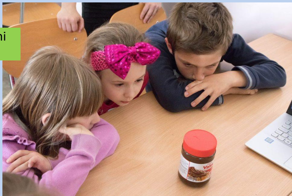
„Escape game: ovládni supermarket“.